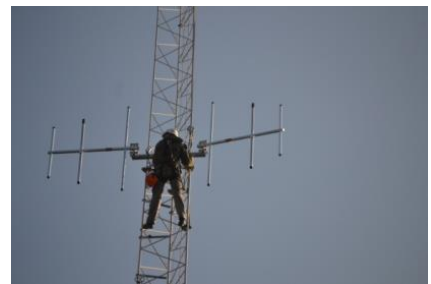
Nieuwe antenne wordt opgehangen

In 2018 is de telefooncentrale vervangen en de software voor het maken van radioprogramma's.